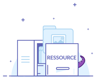
Catégories de ressources