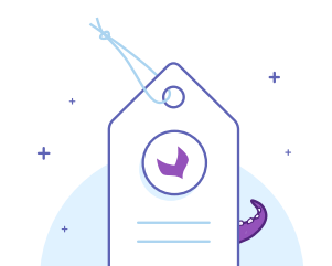
Attributs et options