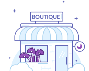
Canal par défaut