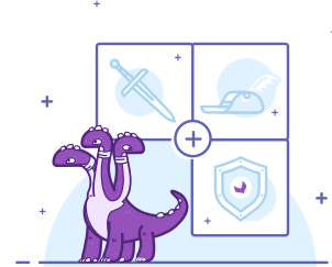
Tipos de asociaciones