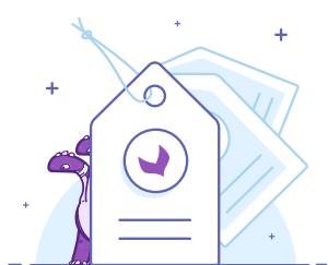
Grupos de atributos